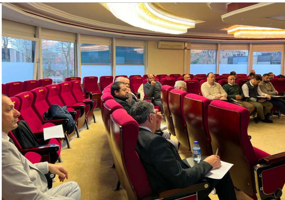
Foto's van de brainstormdag